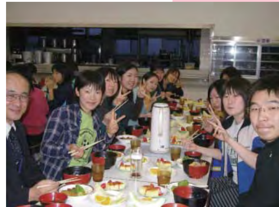
学寮食堂 The dining-room of the dormitory