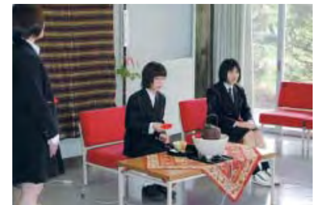
茶道 Tea Ceremony