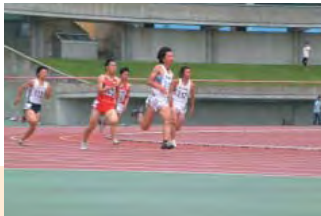
陸上競技 Track and Field