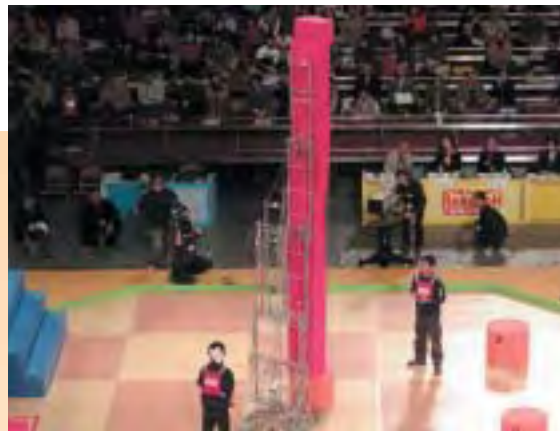
メカトロ技術研究 Mechatronics

※は同好会 Association of like-minded persons