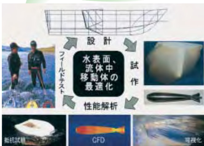
水表面・流体中移動体の最適化プロセス（共同研究）