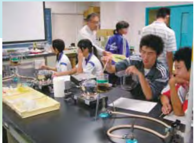
おもしろ科学講座（開放事業）