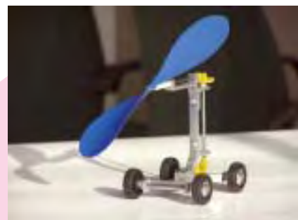
放電加工を使った教材製作