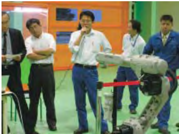
音声認識ロボット（共同研究）